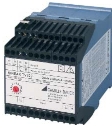
Fig. 2. SINEAX TV 829, article no 158 320 and 158 338.