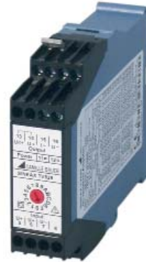
Fig. 1. SINEAX TV 829, article no 158 312.